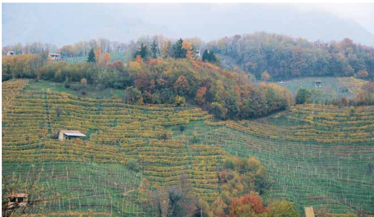
Miane. Paesaggio agrario della Valsana